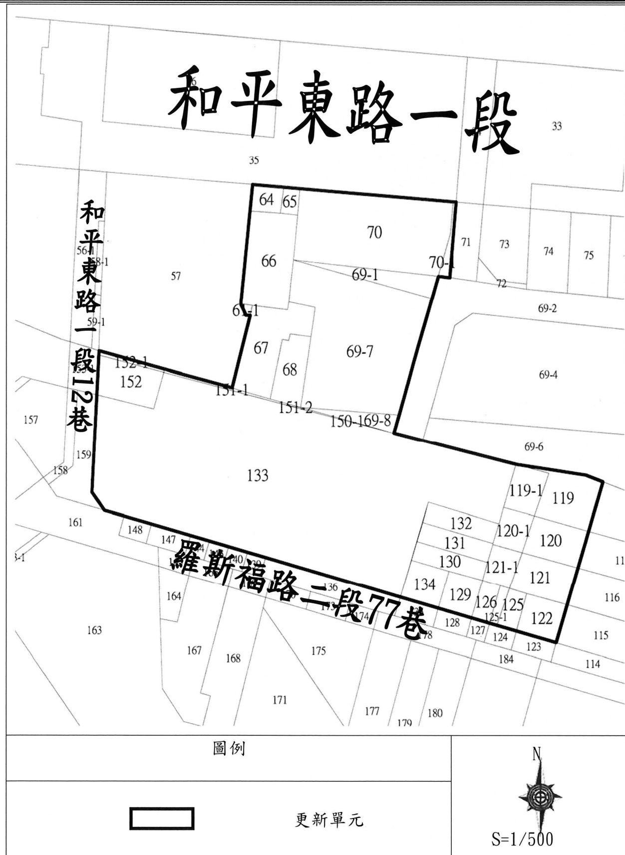
圖 2-2 更新單元地籍套繪圖